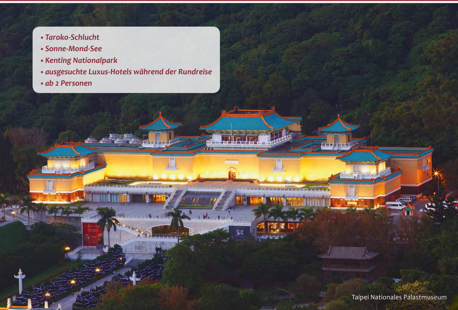
Taipei Nationales Palastmuseum