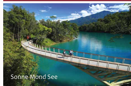
Sonne Mond See

Der Eingang zu der spektakulären Taroko-Schlucht liegt fast am Meer. Der Fluss Liwu windet sich durch die Berge, die rund 3.000 hoch aufragen. Die Felswände sind aus Marmor. Immer wieder bieten sich spektakuläre Aussichten auf die tosenden Wasser. Neben der beeindruckenden Natur gibt es auch viele faszinierende Zeugnisse menschlicher Technik zu bewundern. Die Straße, die unter unmenschlichen Anstrengungen in die steilen Felswände geschlagen wurde, ist rund 192 Kilometer lang. Zahlreiche lange Tunnel gilt es zu durchfahren. Überall gibt es kleine Pavillons und rauschende Wasserfälle zu bestaunen.